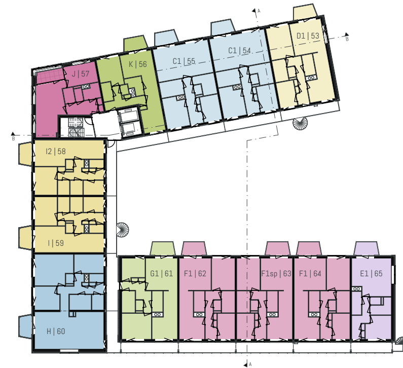
05 vijfde verdieping